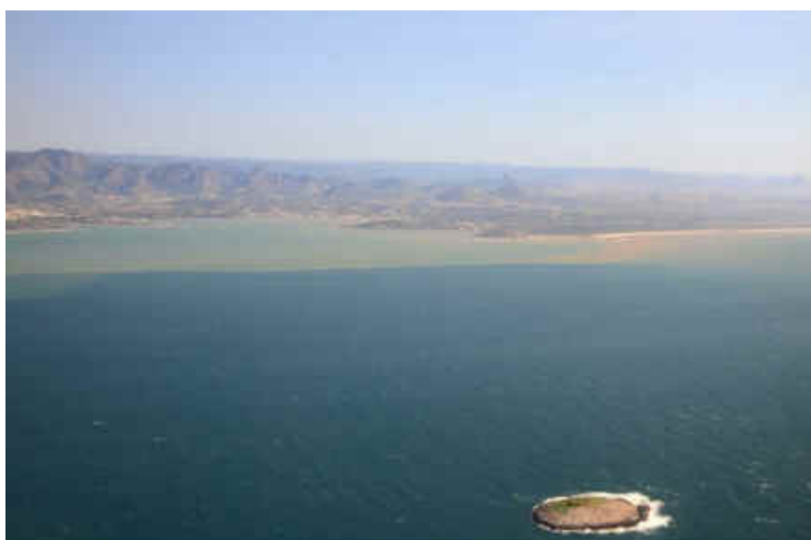
Figura 1: Pluma de sedimentos em Guarapari (ES).

Em uma Informação Técnica conjunta, o Centro TAMAR e o RVS de Santa Cruz concluíram, a partir de um sobrevoo de maior extensão realizado em 27 de abril de 2016, que a pluma de sedimentos atingiu, em proporções e concentrações variadas, desde o norte da costa do estado do Rio de Janeiro até Conceição da Barra, o município costeiro mais ao norte do estado do Espírito Santo. Foram registradas dezenas de fotografias de manchas contínuas ou descontínuas em diversos pontos da costa capixaba, incluindo as porções costeiras da APA Costa das Algas e do RVS de Santa Cruz (CENTRO TAMAR & RVS SANTA CRUZ, 2016). Na Figura 1, feita com o helicóptero próximo à Ilha Escalvada, pode ser vista a pluma de sedimentos no mar de Guarapari, no sul do Espírito Santo. A Figura 2 mostra a presença da pluma de rejeitos em área da APA Costa das Algas.