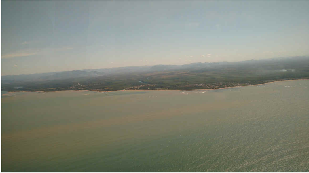
Figura 2: Área da APA Costa das Algas ao sul do rio Piraquê-Açu.